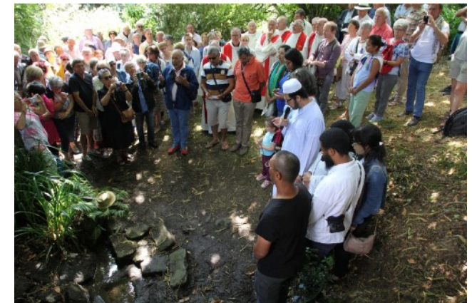
La lecture de la sourate des Gens de la Caverne (pardon 2019).