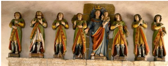
Les sept statues des Dormants d'Éphèse de la chapelle.