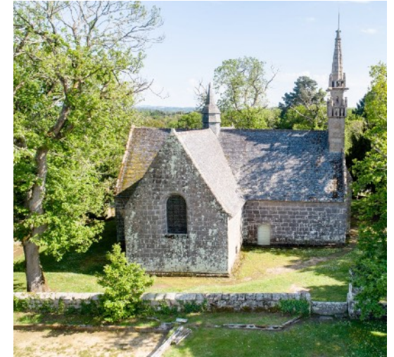
La chapelle des Sept-Saints.